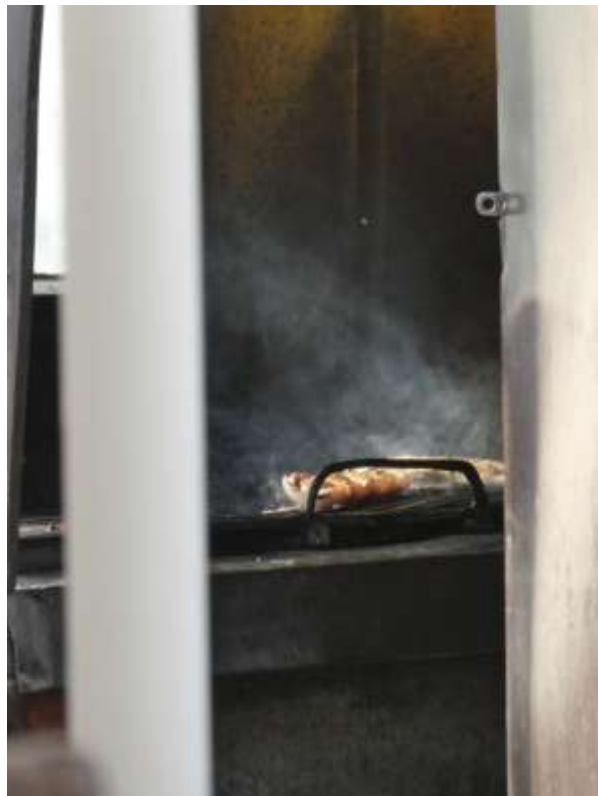
Open Air Festival Lent in Maribor