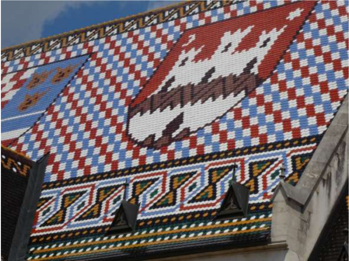
Auf dem Markt in Zagreb