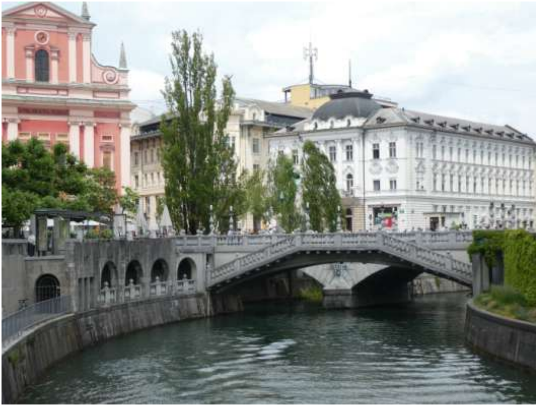
Einer der berühmten Drachen in Ljubljana