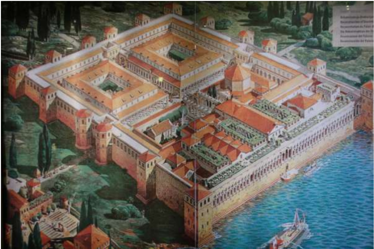
Split bei Sonnenschein und Frühlingswärme