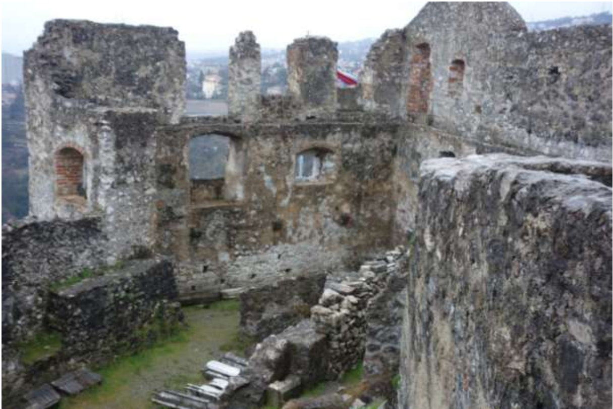
Kathedrale St. Vito