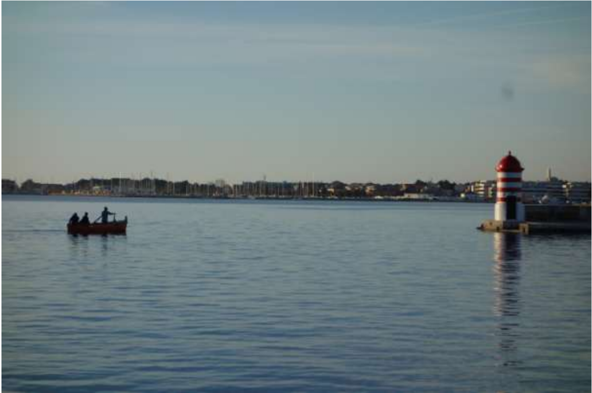
Nacht in Zadar