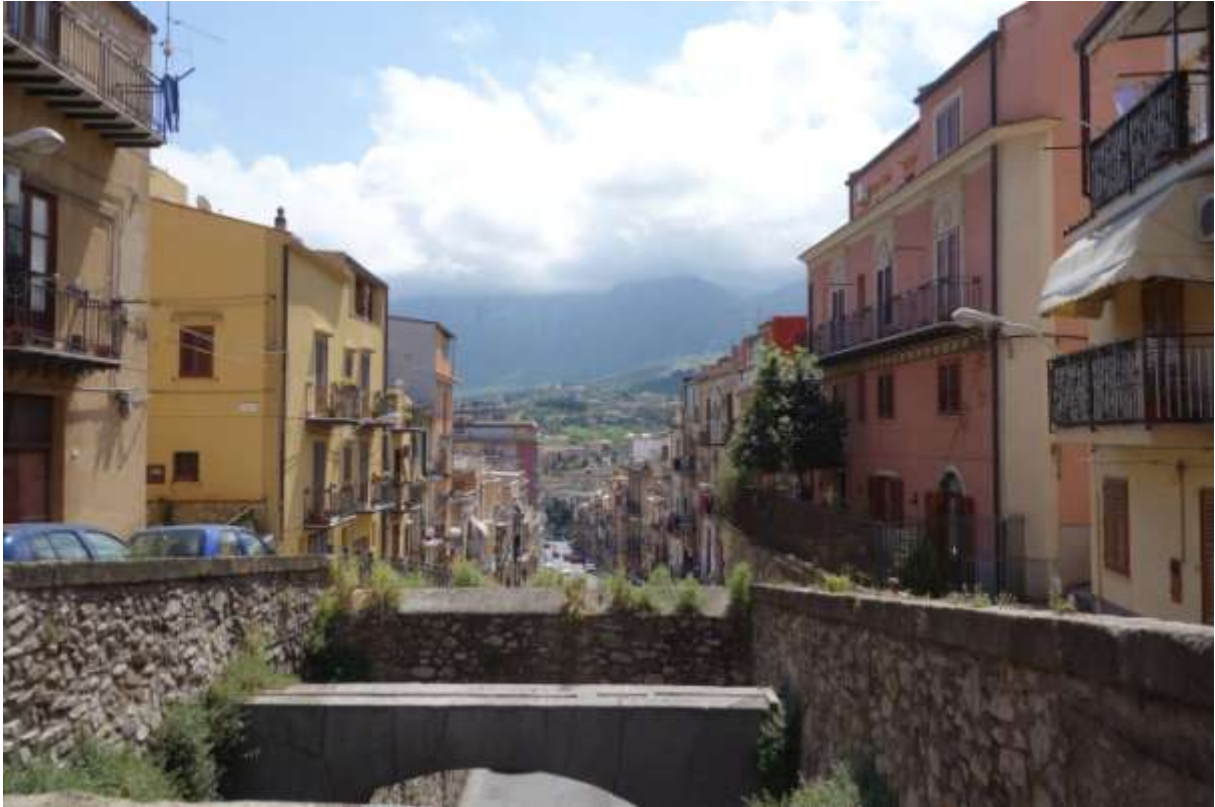
Zurück in Cefalu